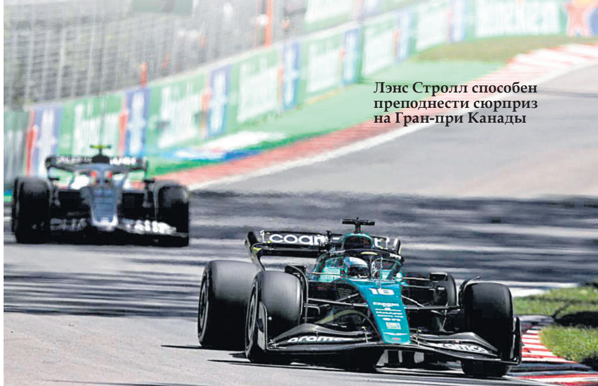
Лэнс Стролл способен преподнести сюрприз на Гран-при Канады

В чемпионате «Формулы-1» гонщики «Ред Булл» выиграли уже семь гонок подряд. Макс Ферстаппен стремительно движется к своему третьему чемпионскому титулу. Всё идёт к тому, что нидерландский пилот снова решит все вопросы досрочно. Если конкуренты собираются ему помешать, то пора бы уже братья за дело. Может, сюрпризы произойдут в грядущий уикенд на Гран-при Канады? Квалификация состоится в субботу (начало в 23.00), гонка — в воскресенье (21.00).