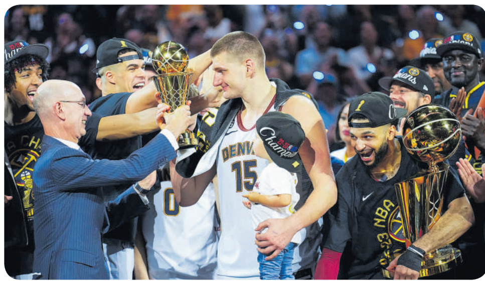
Никола ЙОКИЧ получает приз MVP

Джимми словно вернулся в свои лучшие годы, стал демонстрировать потрясающую эффективность. Атаки «Хит» завершались либо точными бросками Батлера, либо фоломи на нём. В итоге лидер гостей вновь вывел «Майами» вперёд (89:88). Однако позже именно Джимми совершил роковую ошибку для своей команды. Батлер отдал пас... игроку «Денвера» Колдуэлла-Поупу, после чего «Наггетс» снял вопросы о победителе.