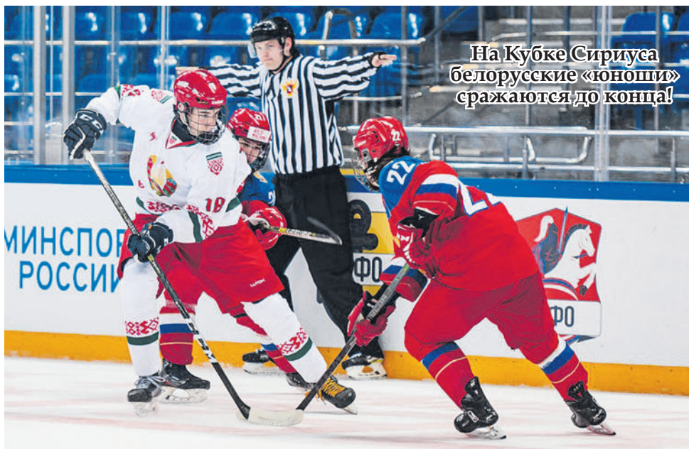
На Кубке Сириуса белорусские «юноши» сражаются до конца!