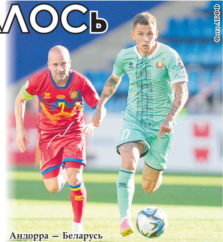
Андорра — Беларусь

Что изменилось в игре нашей национальной коман-