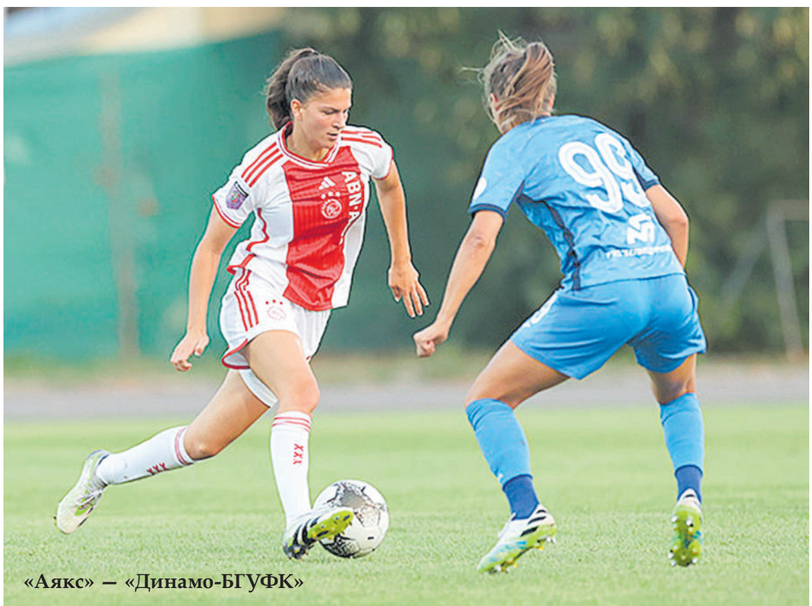
«Аякс» — «Динамо-БГУФК»

снял все вопросы о победителе усилиями Бюхберг.