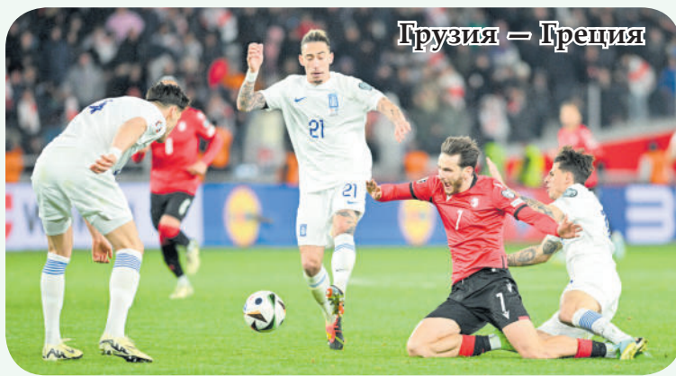
Грузия — Греция

Турнир пройдёт на полях Германии с 14 июня по 14 июля.