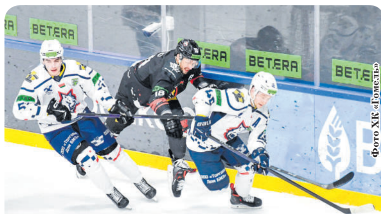
«Гомель» — «Металлург»

31.03. Брест — Шахтёр (14,25). 1.04. Металлург — Гомель (17,55).