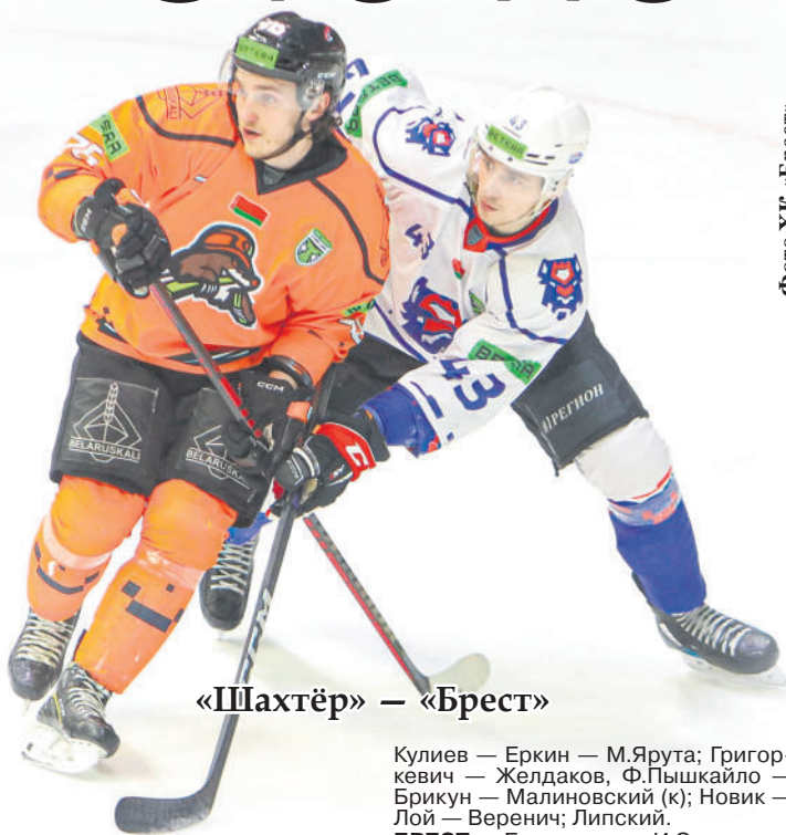
«Шахтёр» — «Брест»

Вскоре «кроты» восстановили статус-кво — это