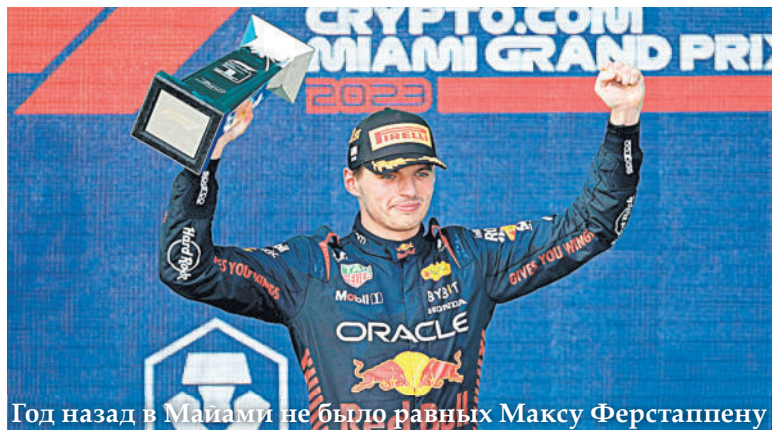
Год назад в Майами не было равных Макс Ферстаппену