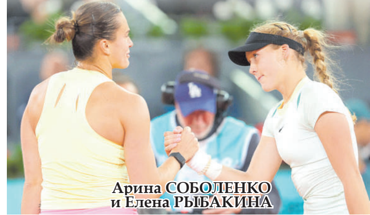
Арина СОБОЛЕНКО и Елена РЫБАКИНА

Очень хочется верить в то, что Арина Соболенко на стыке четверга и пятницы смогла обыграть Елену Рыбакину и выйти в финал турнира WTA 1000 в Мадриде.