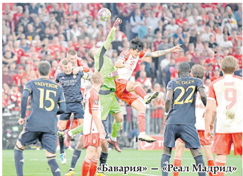
«Бавария» — «Реал Мадрид»

— Это футбол. В большинстве случаев он прекрасен. Но иногда может случиться подобное. Мы бы предпочли оказаться в лучшей ситуации. Была равная игра. Мы знали, что будет нелегко. Раздевалка немного переживает. В Париже мы будем очень сильны, нам нечего терять.