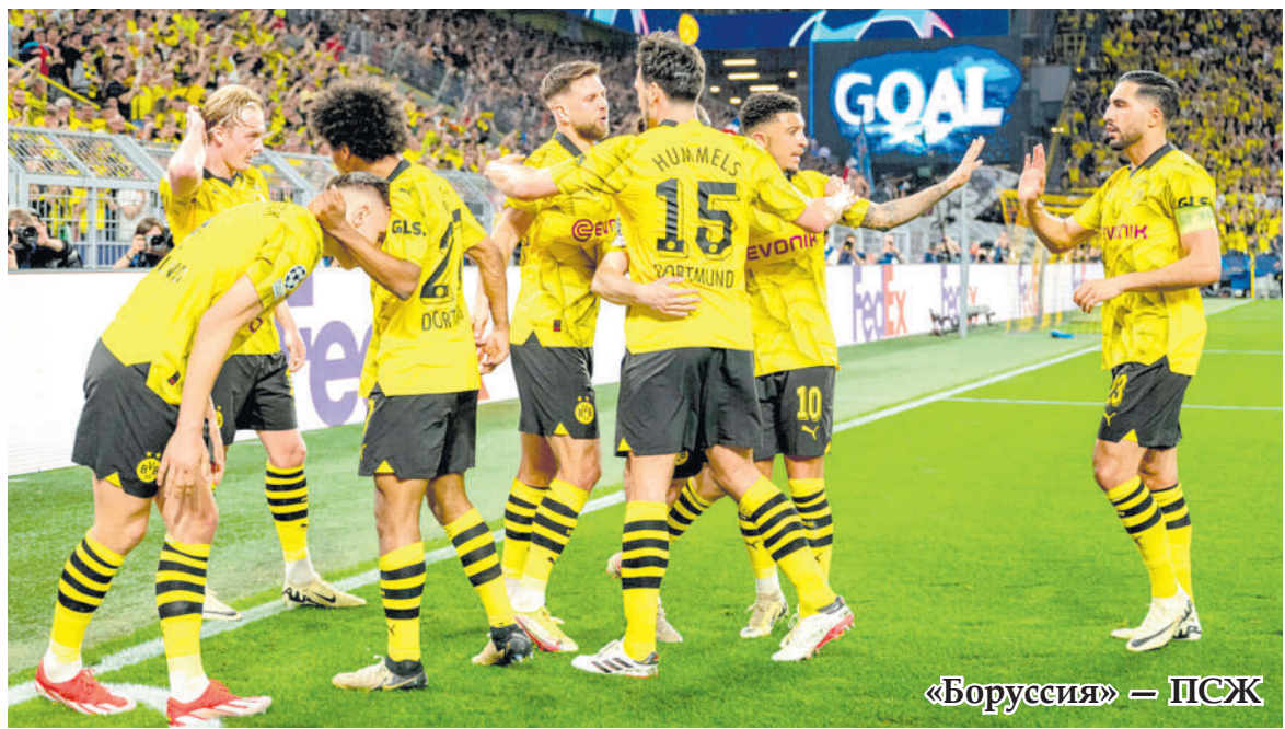
«Боруссия» — ПСЖ

— Мы здорово начали игру и могли открыть счёт уже на первой минуте. После этого мы перестали следовать плану. Пропустили, и всё усложнилось. Во втором тайме ситуация улучшилась, мы стали играть более решительно. Сделали счёт 2:1 и имели ещё много моментов — надо было забивать третий гол. Ощущения странные. Соперник