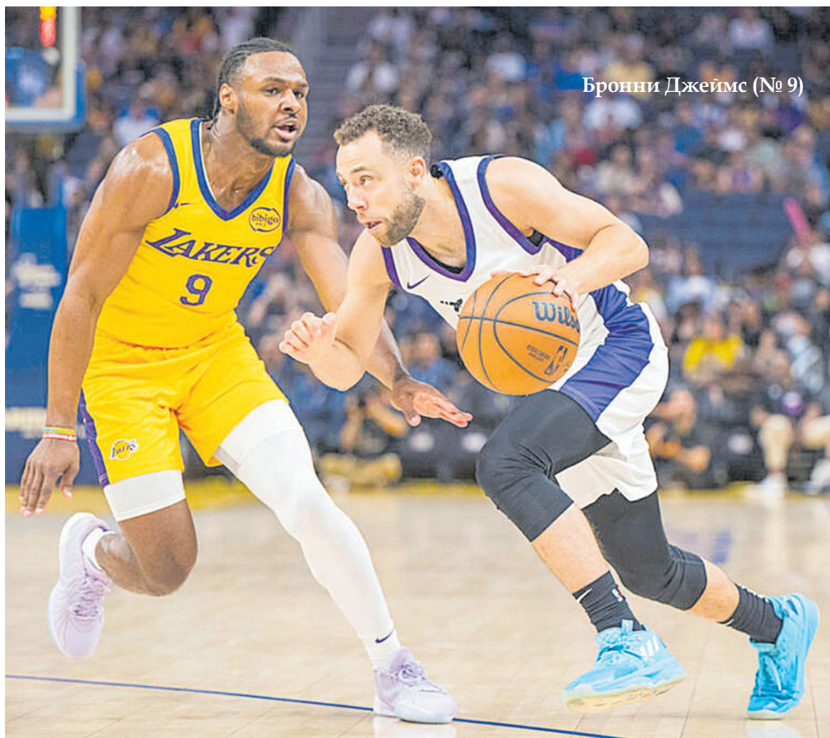
Бронни Джеймс (№ 9)

За последние годы проблема наркомании среди молодежи стала одной из самых острых и по своим масштабам уже угрожает национальной безопасности многих стран.