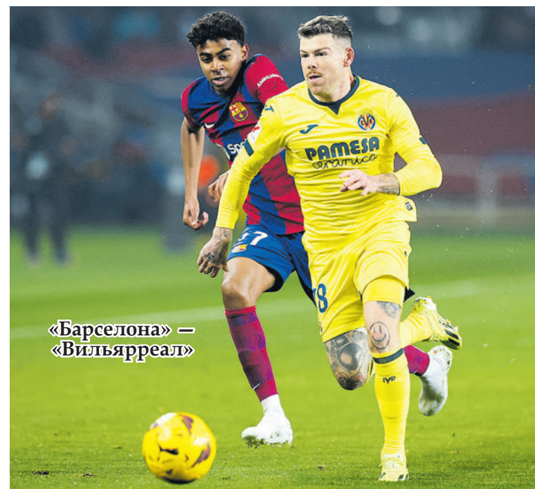
«Барселона» — «Вильярреал»