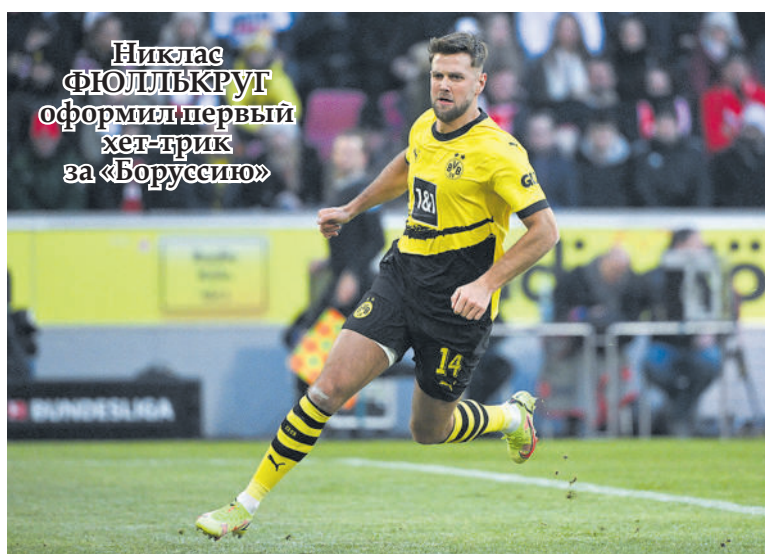
Никлас ФЮЛЛКРУГ оформил первый хет-трик за «Боруссию»

зывать немецкого специалиста с приходом в мюнхенский клуб. На подобные слухи отреагировал капитан «Баварии» Нойер: «Считаю, это от него зависит. Не думаю, что «Бавария» имеет что-то против этого. Юрген — известный, очень хороший, опытный, тактически грамотный тренер, который пользуется огромным уважением у всех футболистов и спортсменов. Я думаю, что он определён кандидатом и мог бы однажды поработать в «Баварии». Если говорить про Тухеля, то в нём заинтересован «Манчестер Юнайтед» — в Томасе