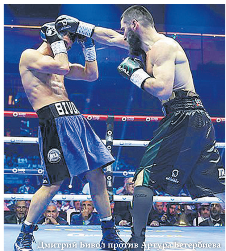
Дмитрий Бивол против Артура Бетербиева

«Независимо от порядка: Винисиус, Беллингем, Карвахаль. Трое должны решить между собой. Я бы отдал награду и себе. Главное, чтобы это был футболист мадридского «Реала», потому что мы были самой успешной командой в Европе», — приводит слова Крооса испанская пресса.