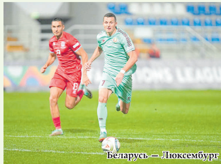
Беларусь — Люксембург