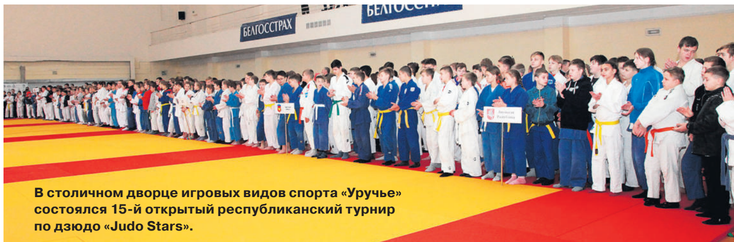
В столичном дворце игровых видов спорта «Уручье» состоялся 15-й открытый республиканский турнир по дзюдо «Judo Stars».